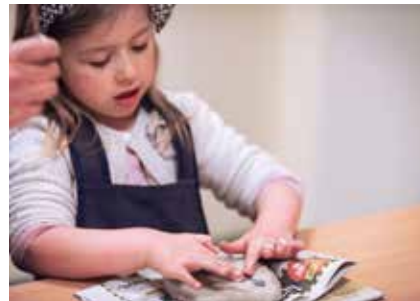
01. Matières, formes, volumes. Bas-relief en terre

Durée (visite + atelier) : 2h Coût: 3€ par élève