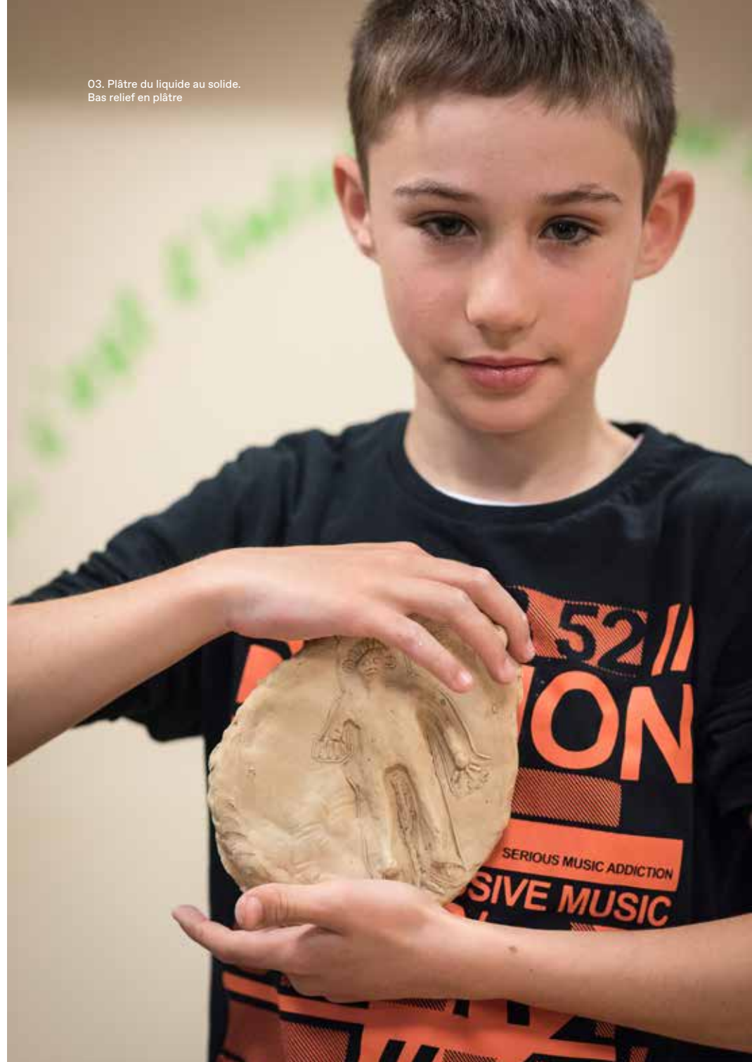
03. Plâtre du liquide au solide. Bas relief en plâtre

Les participants retrouvent leur réalisation qu'ils démoulent, qu'ils polissent et sur laquelle ils vont appliquer une patine de couleur. Chacun repart avec une sculpture décorative inspirée des modèles créés par Ianchelevici, peinte en des tonalités variées. Par ailleurs, ils réaliseront également un modelage en terre qui servira à façonner un moule en négatif, dans lequel ils couleront un deuxième plâtre. Cette double séance leur permettra d'aborder les 2 techniques de coulage et de repartir ainsi avec 2 types de sculptures différentes.