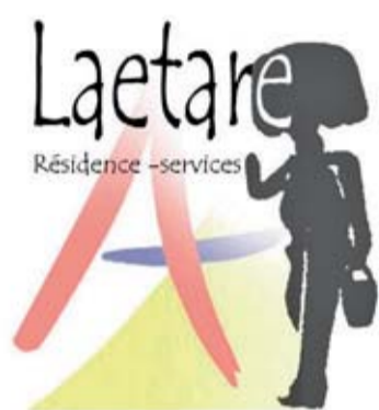
CPAS DE LA LOUVIERE