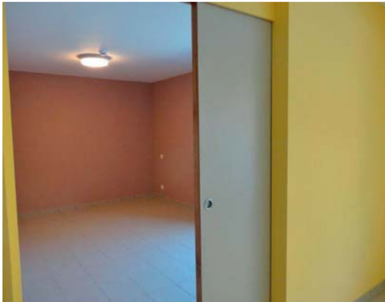
Intérieur salon chambre

Pour ceux qui le désirent, des services (payants et donc facultatifs) sont mis à la disposition des résidents : repas journalier, nettoyage hebdomadaire du logement, entretien du linge personnel.