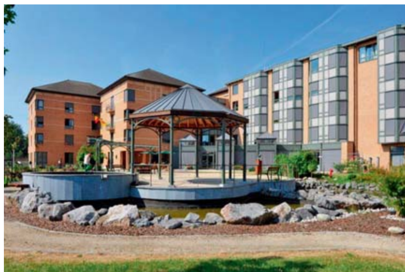
Site de la rue du Moulin