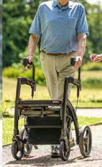
Tribunes & Rollators