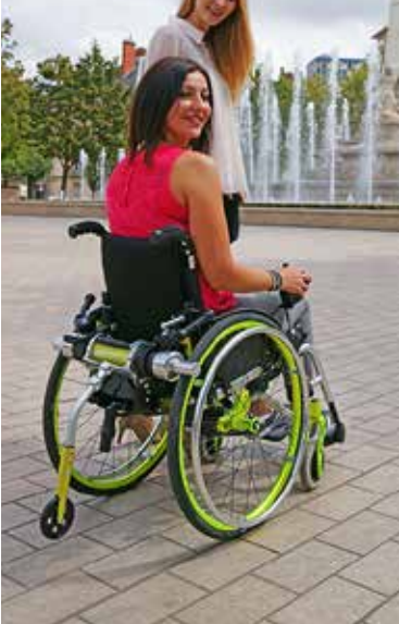
Aides à la propulsion

Profitez de l'extérieur grâce à notre gamme mobilité !