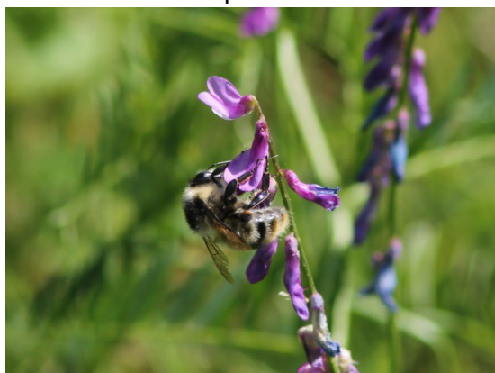
© M. Folschweiller - Le Bourdon grisé ( Bombus sylvarum ) est une espèce protégée en Wallonie et en danger critique d'extinction.

Le déclin des abeilles sauvages a été détecté en Belgique dans les années 1980 grâce à la présence de spécialistes des abeilles dans la région. En 2005, on annonçait déjà que la moitié des espèces d'abeilles étaient rares, en déclin ou disparues. Aujourd'hui, une Liste Rouge des abeilles sauvages de Belgique est en cours de réalisation et les premiers résultats sont malheureusement plutôt alarmistes.